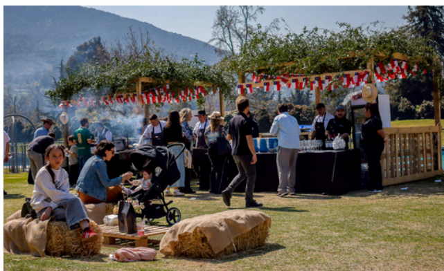
Celebración Fiestas Patrias