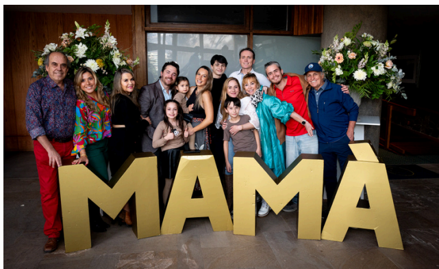
Celebración Día de la Madre