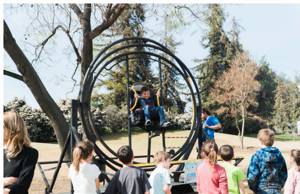
Celebración Día del Niño