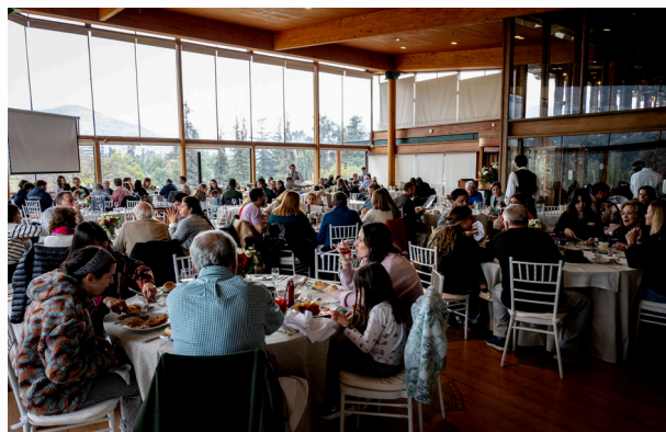
Celebración Día del Padre